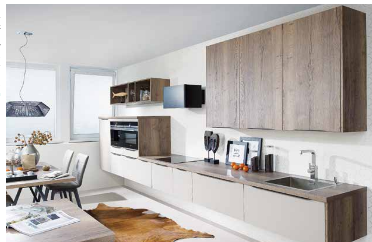
TÍLIA II: Zavesenie skriniek na stenu si vyžaduje pevný nosný materiál. Kvalitné kovanie je súčasťou skriniek. Decodom