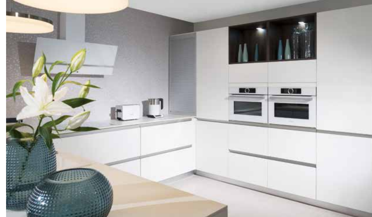
OLA: Energobloky majú presné pravidlá umiestnenia elektrických zásuviek za skrinkami – tak, aby neprekážali umiestneniu elektrospotrebičov. Decodom