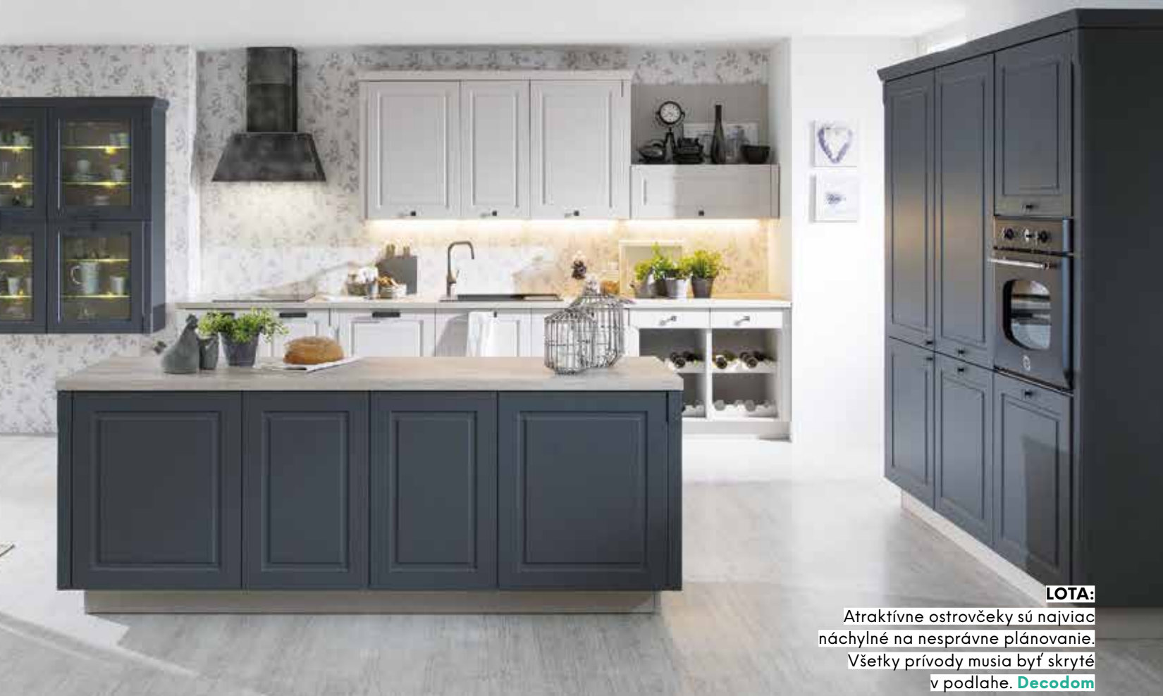
LOTA: Atraktívne ostrovčeky sú najviac náchylné na nesprávne plánovanie. Všetky prívody musia byť skryté v podlahe. Decodom